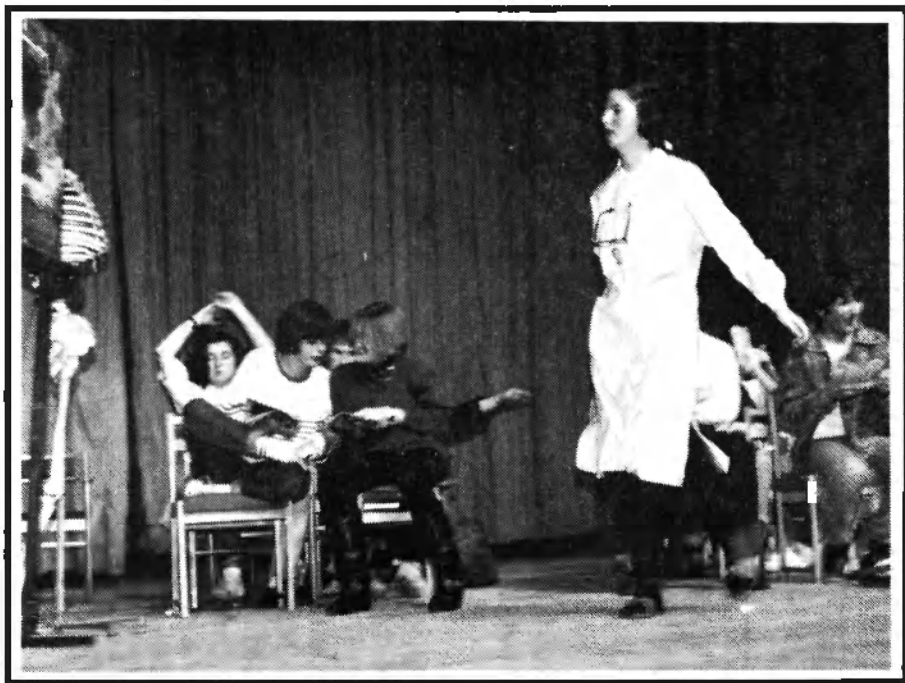
Nyelvi est 1992-ben