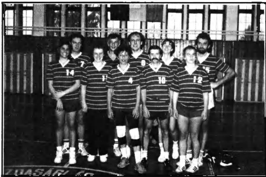
A győztes tanári kosárlabda csapat, a Vegyipari Szakközépiskola által szervezett jubileumi tornán 1991-ben