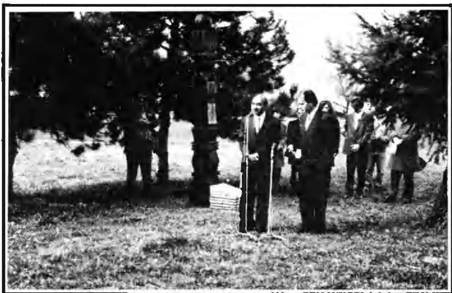
Beszédet mond Surinder Lal Malik az Indiai Köztársaság nagykövete Kőrösi Csoma Sándor halálának 150 éves évfordulója alkalmából 1992. április 13-án, az iskolánk állította kopjafánál