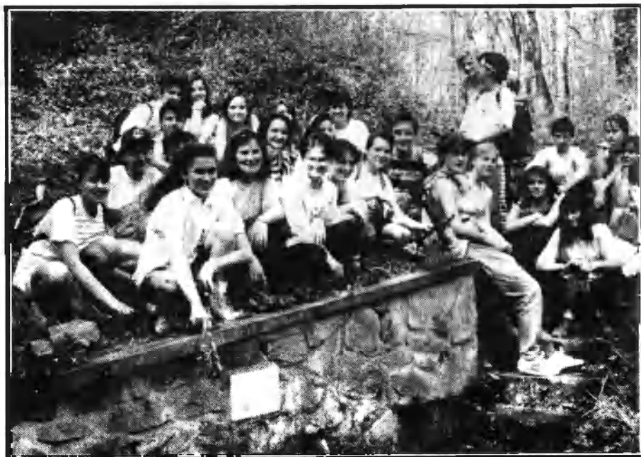
Thúry-túra résztvevői a Hervaszközi-forrásnál 1993-ban