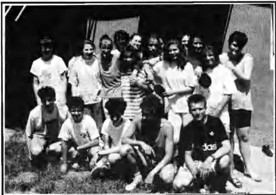
A 3.D örömhegyi táborozása 1993-ban