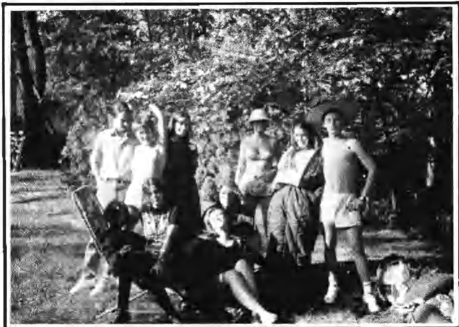
A 4.C bélatelepi táborozása