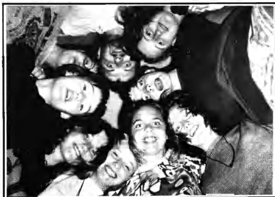
A 2.B vidám kirándulása 1994-ben