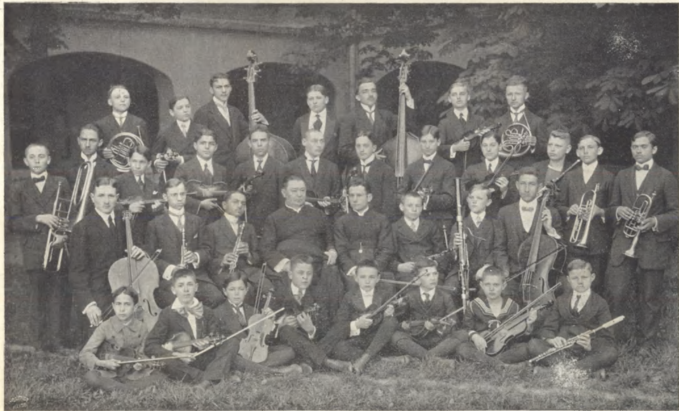
A nagykanizsai kath. főgimnázium zenekara az 1913—14. tanévben