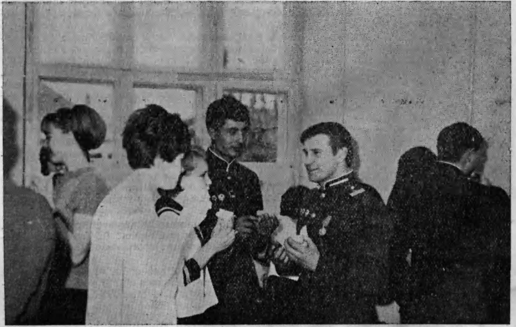
A student in a uniform interacting with other students in a hallway.