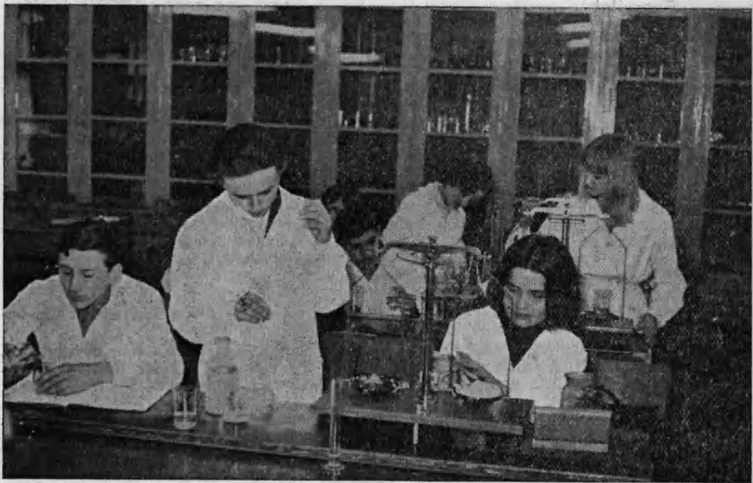
Students in the chemistry laboratory working on their experiments.